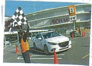
よくあるコースの例

「パイロン(マーカー)」で設定したコースを1台ずつ走って、ペナルティが最も少なかった人が優勝です。パイロンに接触したり、コースを間違えるとペナルティとなります。「運転の正確さ」を競うスポーツなので、特殊な運転技術より「ていねいさ」が大切です。